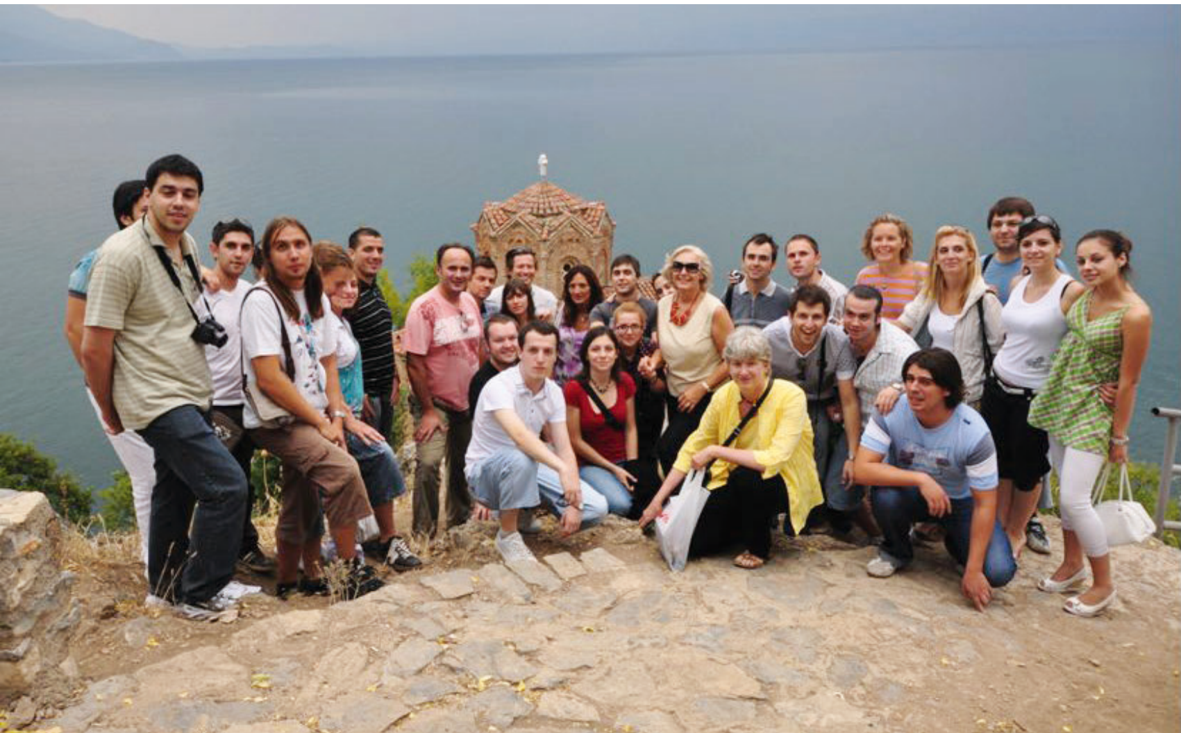
Sudionici ljetne škole senZations 2009. na Ohridu