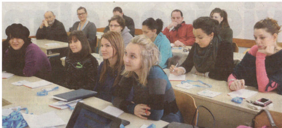
Projekt ima međunarodni karakter, no loše vrijeme neke je sudionike spriječilo u dolasku u Rijeku

– Sama ideja o INCASO-u je nastala nakon što smo u Rijeci ugostili međunarodnu ljetnu školu SenZations koja se bavi razvojem novih tehnologija. Došlo se do ideje da se bar jednom godišnje organizira međunarodna studentska škola na kojoj bi se, osim studenata Visoke poslovne škole PAR, okupljali i studenti različitih fakulteta iz regije ali i šire, što bi rezultiralo stvaranjem