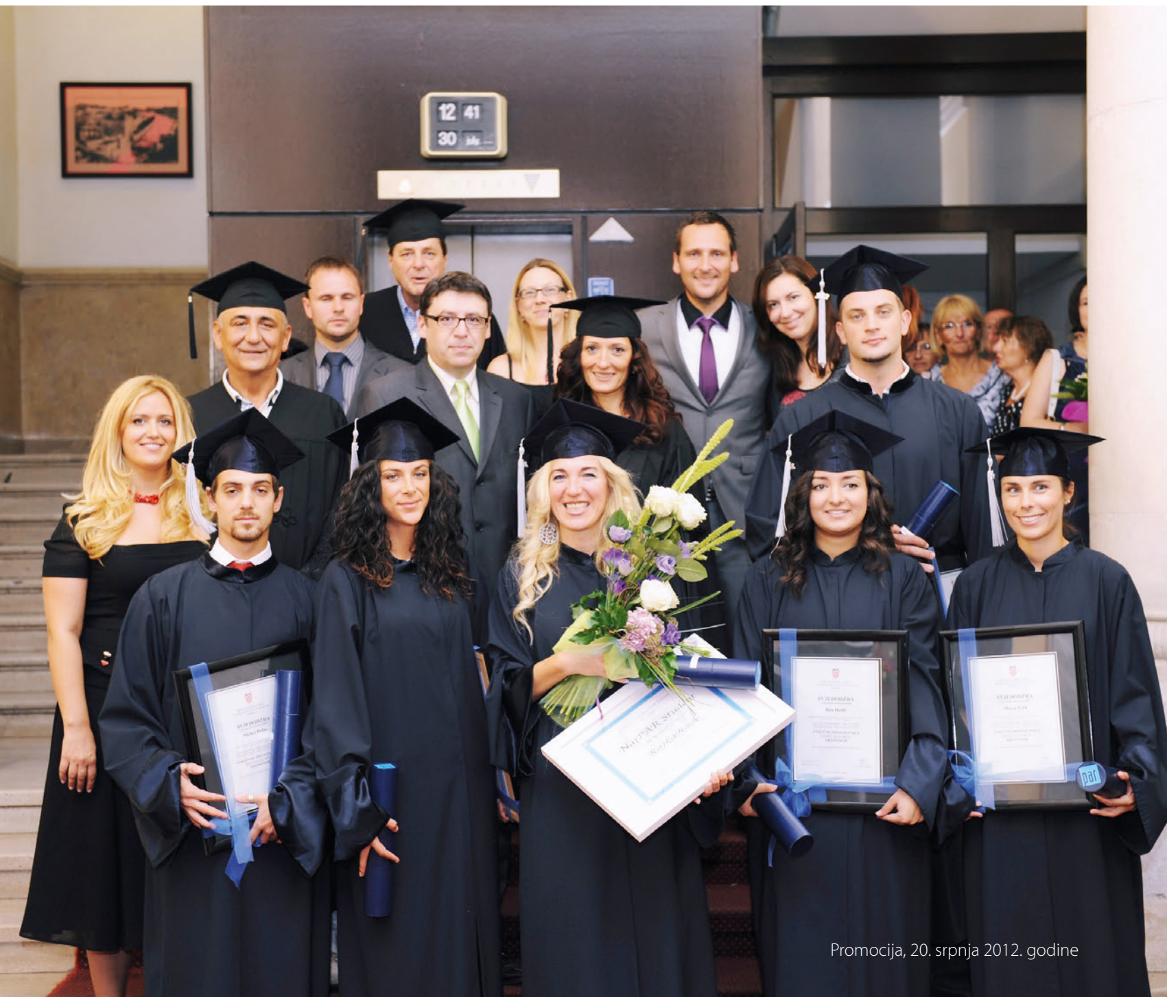
Promocija, 20. srpnja 2012. godine