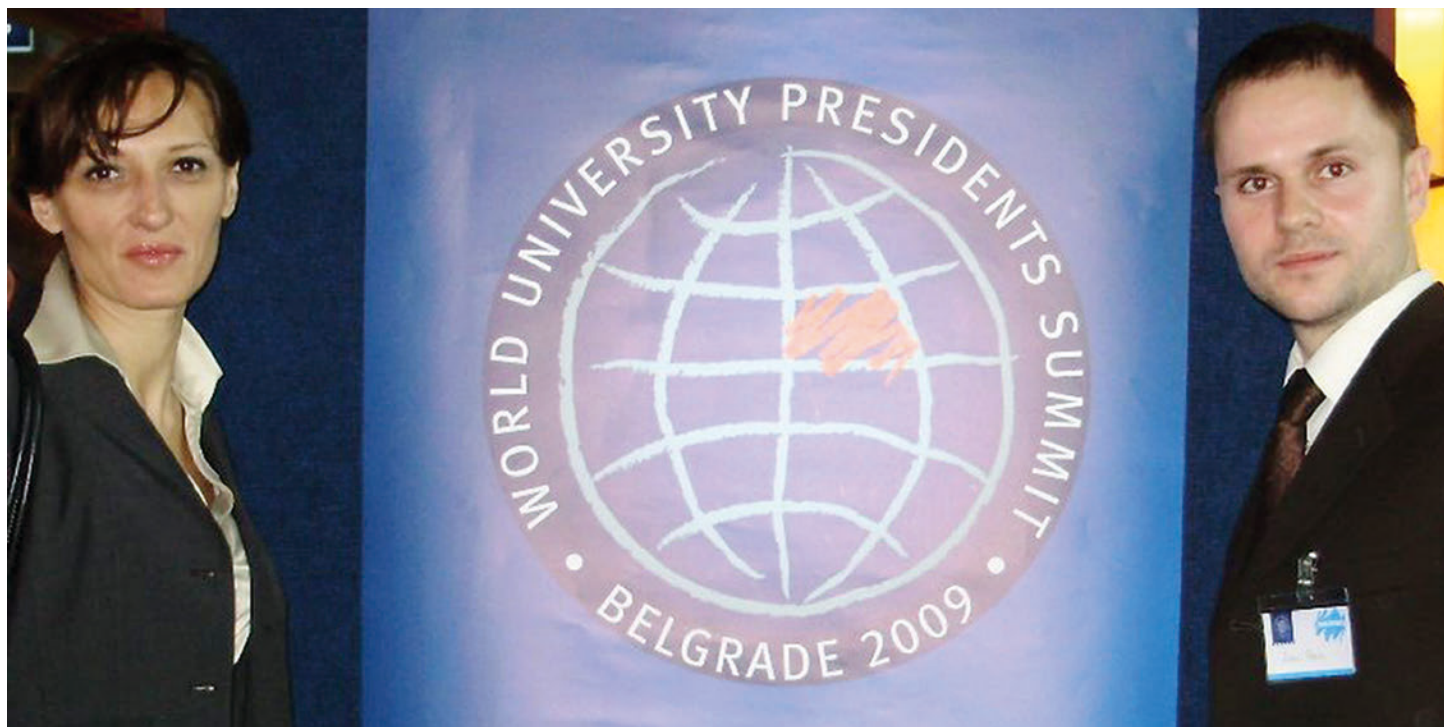
Poslovna akademija na Svjetskoj rektorskoj konferenciji