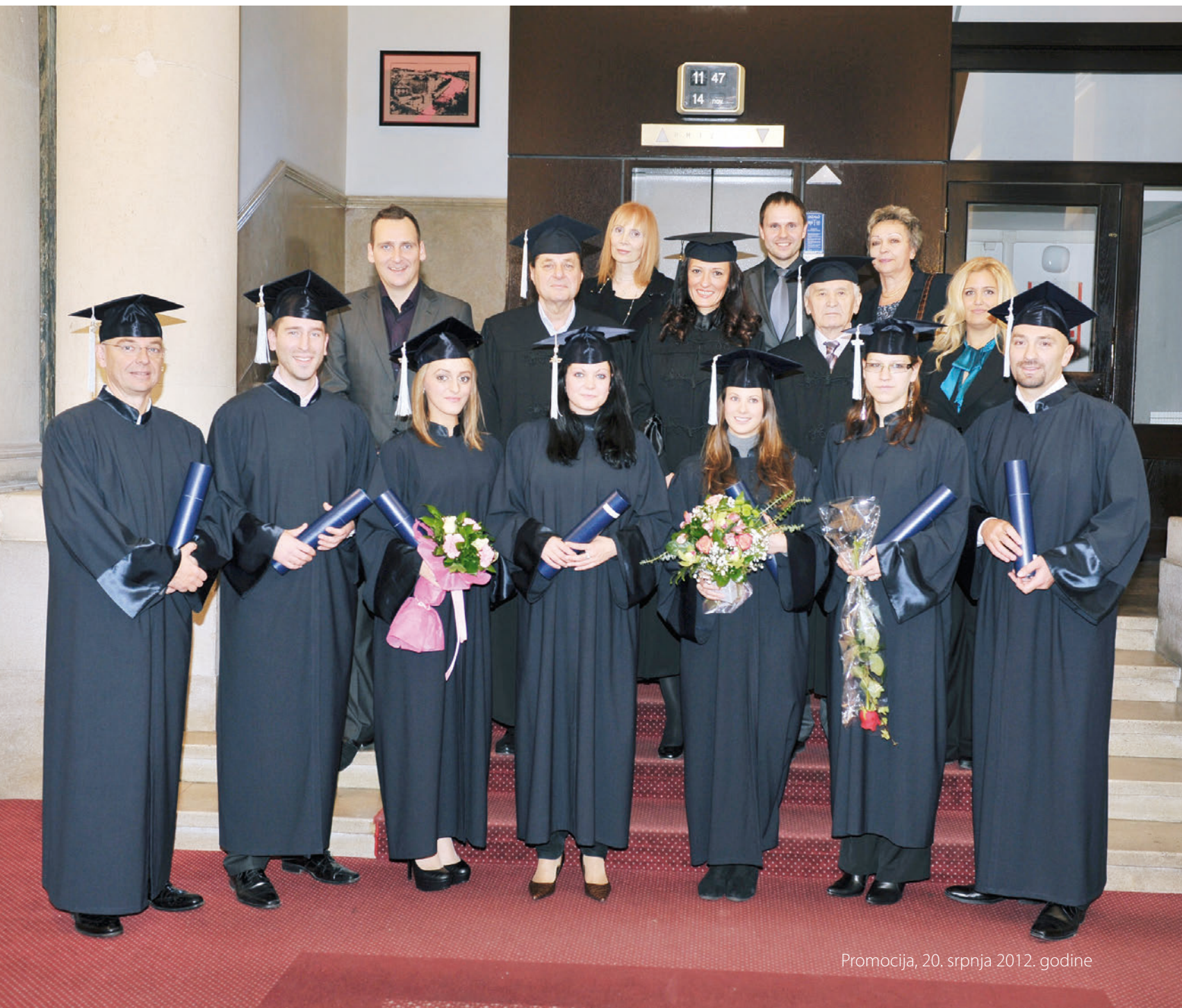
Promocija, 20. srpnja 2012. godine