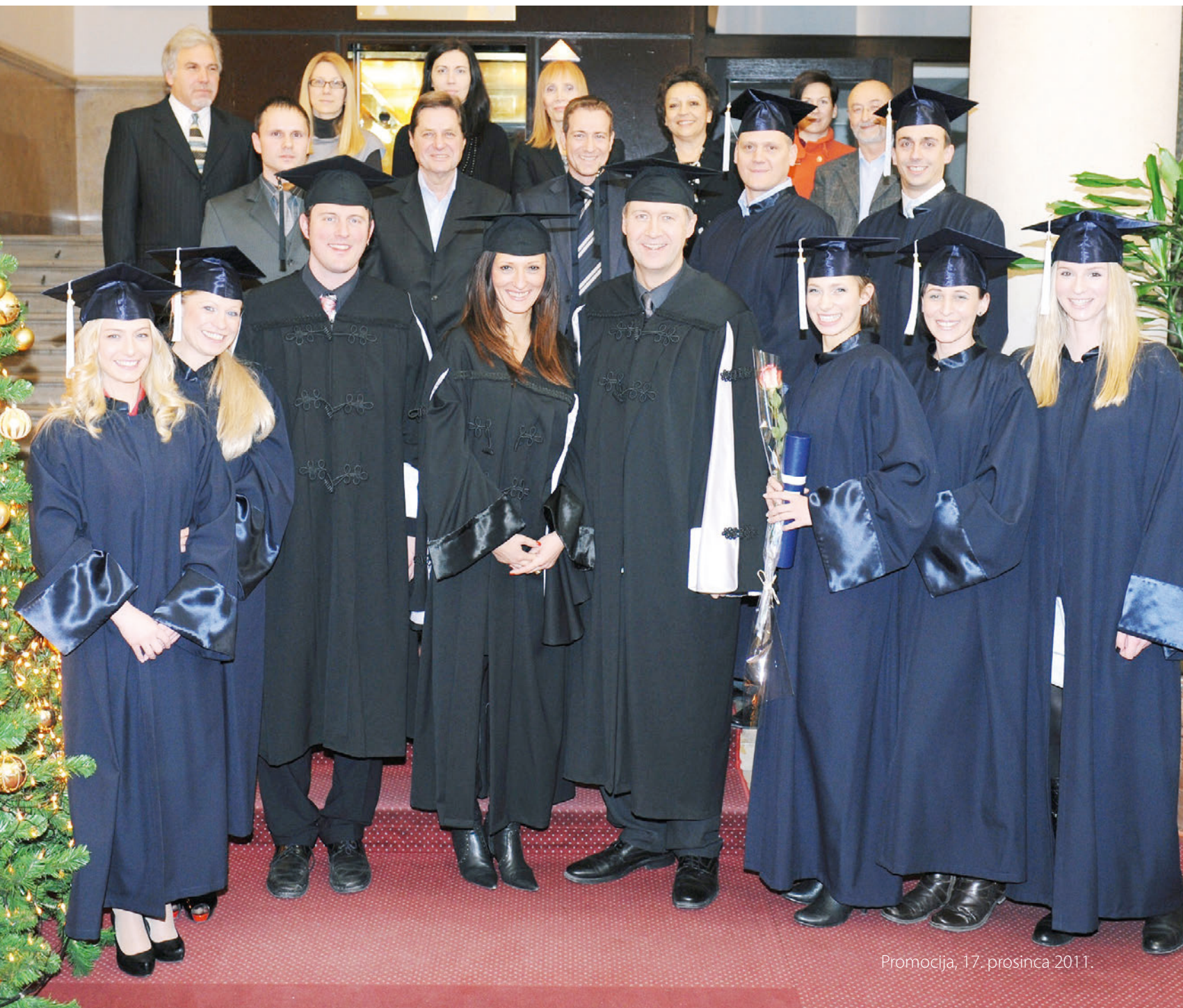
Promocija, 17. prosinca 2011.