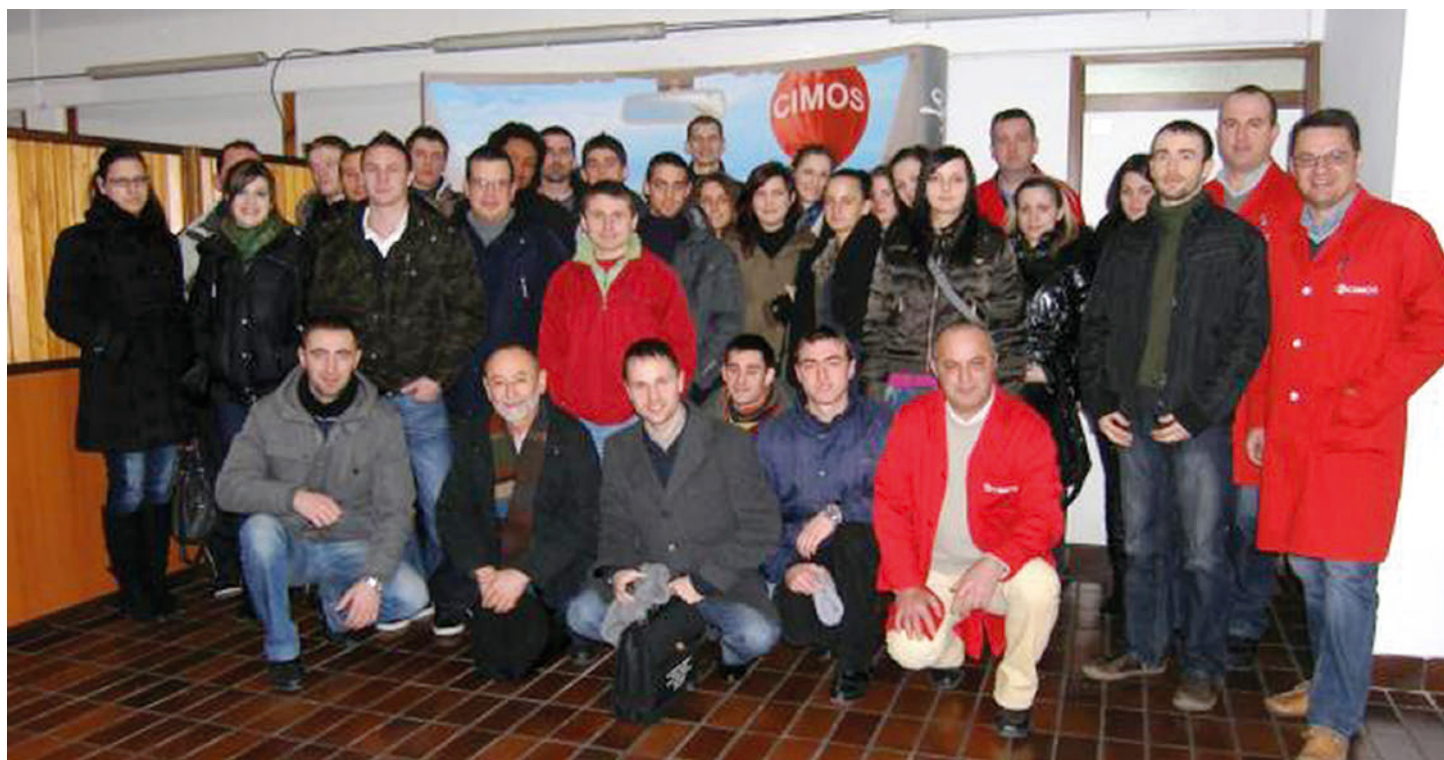
Studijski posjet poduzeću CIMOS d.d. zajedno sa studentima Veleučilišta u Rijeci