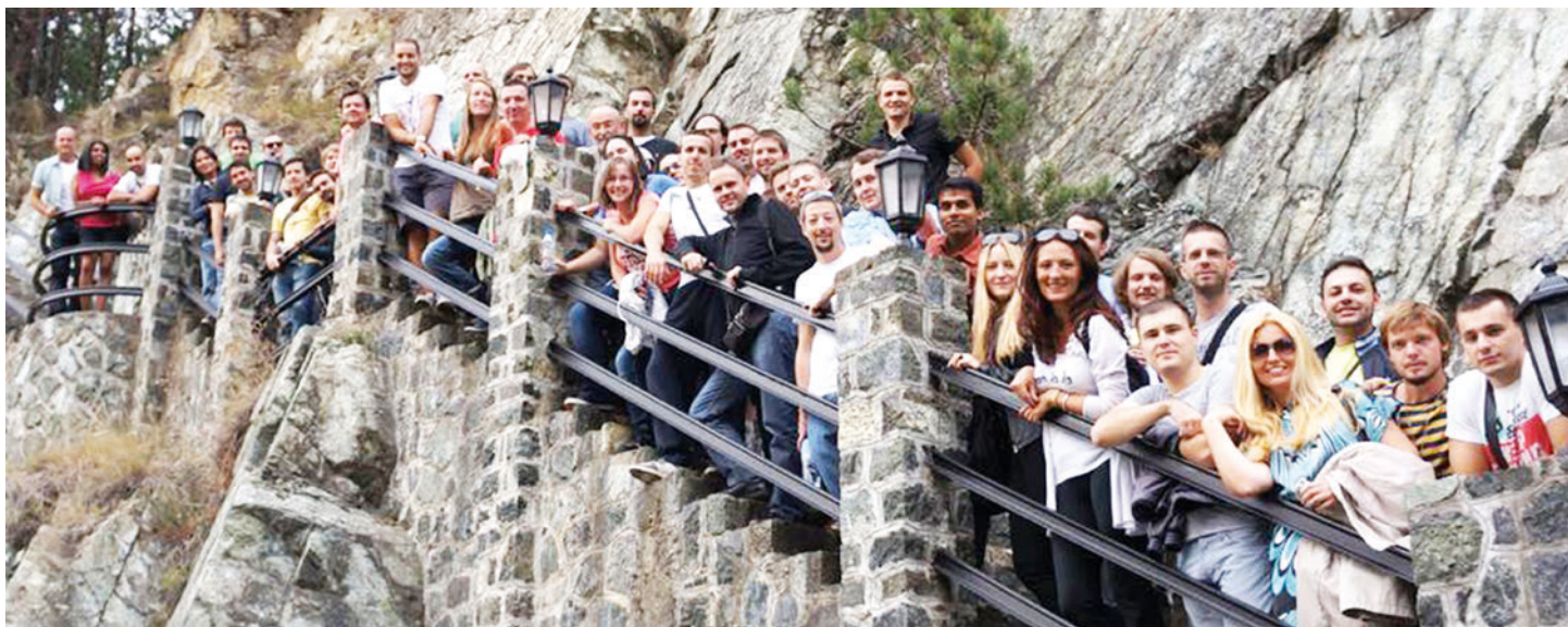
Sudionici ljetne škole senZations 2012, Mećavnik