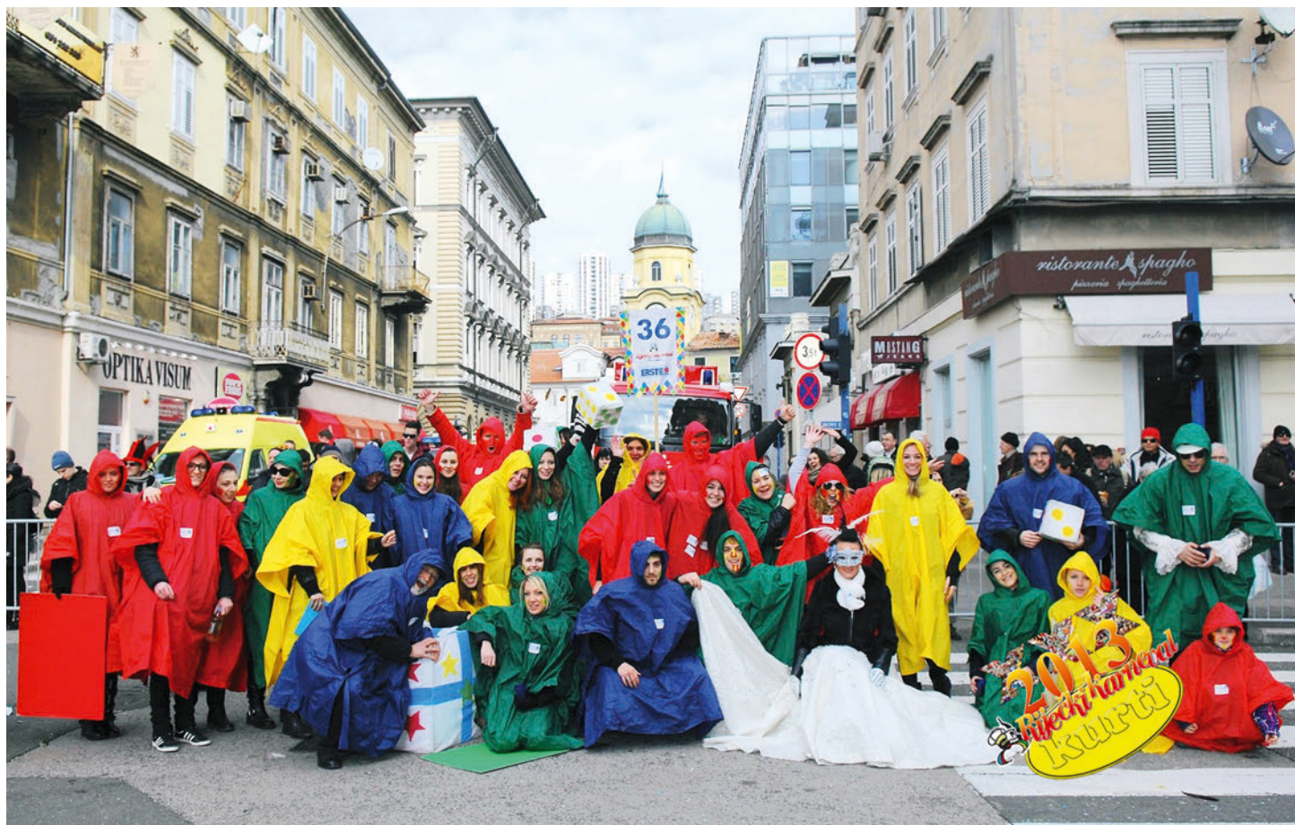
Karnevalska skupina PAR-NEPAR - Riječki karneval 2013.

Karnevalska škola INCASO 2013. iznjedrila je čak tri odlična idejna projekta radnih naziva: Karneval i ja, Upoznaj Karneval i Karnevalski kviz.