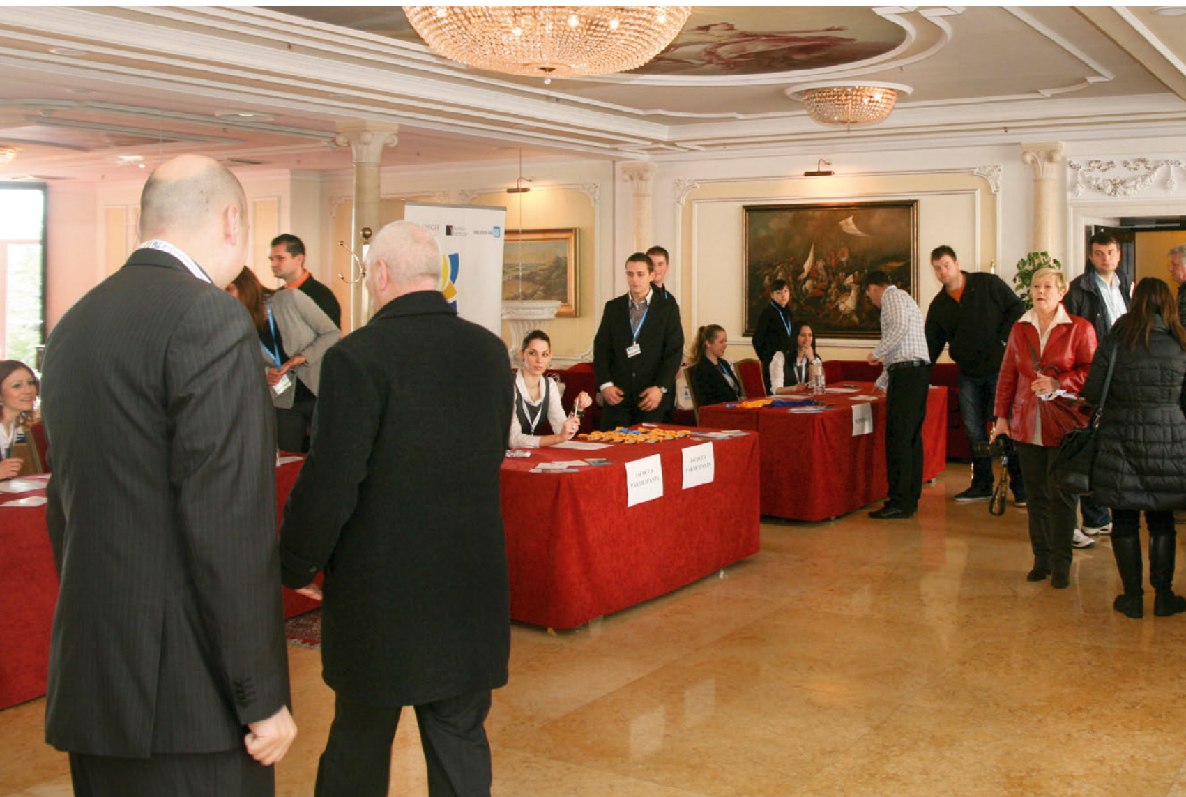
PAR International Leadership Conference 2013