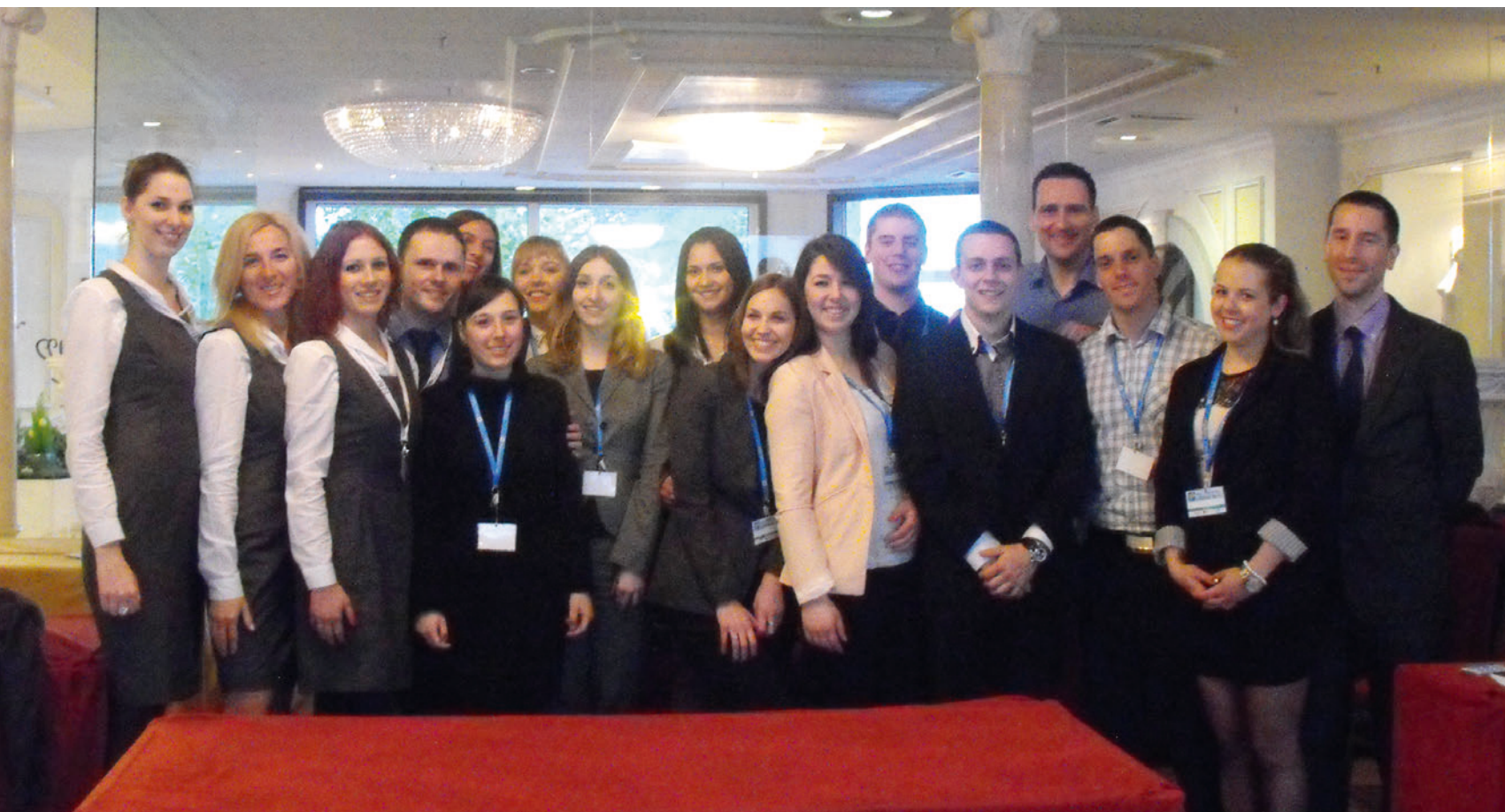
Vrijedne hostese i organizacijski odbor Konferencije PILC 2013.