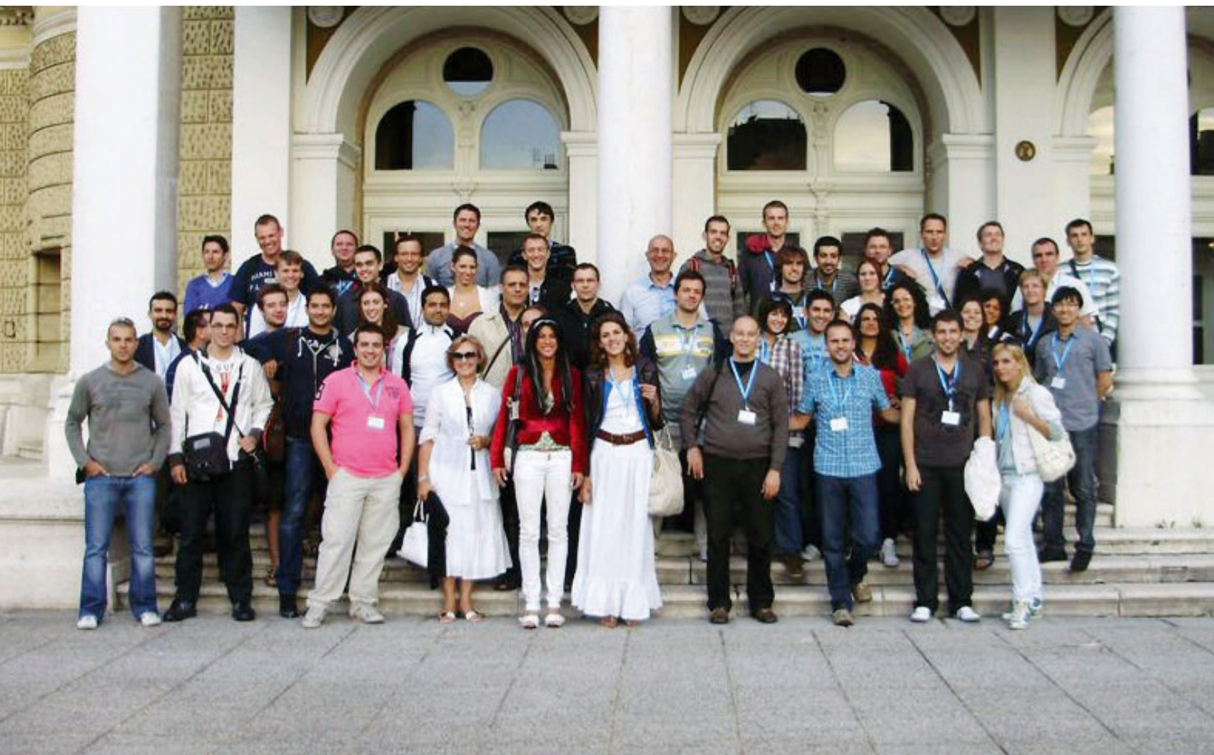
Sudionici ljetne škole senZations 2010. u Rijeci