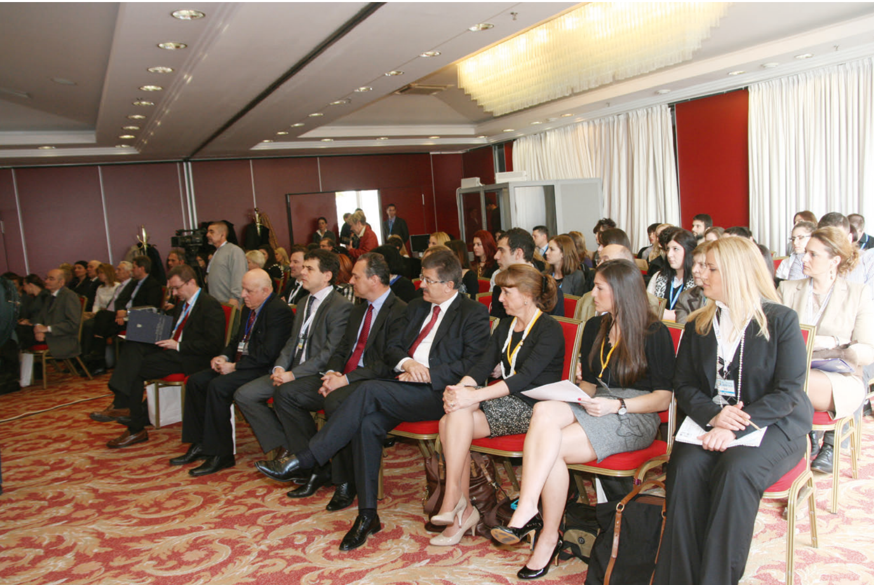
PAR International Leadership Conference 2013